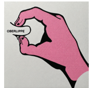
B. Strittmatter - Foto, koloriert nach F.R. Bahr

mehr nach vorne ziehen und dann mit dem Zeigefinger der rechten Hand den Punkt mit raschen Bewegungen innen von oben nach unten massieren. Oder man führt die Zangenakupressur durch.