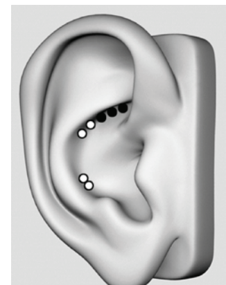
Abb. 3. Grenzstrang am Ohr

Der Grenzstrang ist genau dort, wo die untere Etage des Ohres in eine Mauer hoch geht, in die obere Etage. Wenn Sie also einen negativen Glaubenssatz haben, den Sie