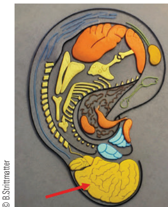
Abb. 1. Gehirn am Ohr (Pfeil)

Das bedeutet, jeder Ärger, jeder Schock, jedes Trauma kann sich damit auch im Grenzstrang „festsetzen“ – und hält dann Emotionen fest, die wir selbst oft nicht mehr wahrnehmen und die uns an anderen Stellen krank machen können. Zum Beispiel die Emotion: Ich darf nicht abnehmen!