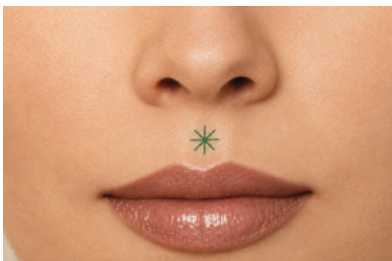
B. Strittmatter - Foto, koloriert nach F.R. Bahr

Original-Zitate Prof. Bahr Sie sehen auf dem Foto, dass der Akupressurpunkt etwa in der Mitte zwischen Nase und Oberlippe liegt.