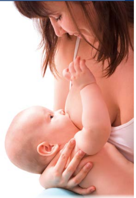
Stillen ist für Mutter und Kind die optimale Ernährungsform.

Stillen steht für die innige Verbindung zwischen Mutter und Kind. Doch wenn die Milch sich staut oder gar eine Mastitis, eine Entzündung der Brust entsteht, kann es zum Albtraum werden. Medikamente helfen hier zuverlässig, die Wirkstoffe können jedoch das Baby belasten. Besser sind deshalb schonende Maßnahmen wie beispielsweise Akupunktur.