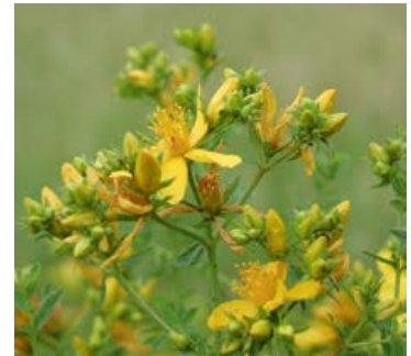
Johanniskraut ist anspruchslos und wächst bei uns auf Wiesen und am Wegesrand.

Das Johanniskraut ist in vielerlei Hinsicht mit Licht und Sonne verbunden: Wenn die Tage im Juni am längsten sind, beginnen sich seine Blüten, die wie kleine Sonnen aussehen, zu öffnen. Kein Wunder also, dass diese Pflanze Sonne in dunkle Gemüter bringt. Die stimmungsaufhellende Wirkung des Johanniskrauts schätzt man auch in der chinesischen Medizin – neben vielen anderen positiven Effekten.