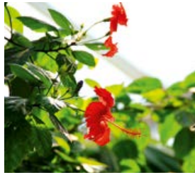
Zimmerpflanzen wie Hibiskus beeinflussen das Wohnklima positiv.

quasi zur Gesundheitspflege der Pflanzen und ermöglicht es ihnen, weiterhin ungehindert Sauerstoff zu produzieren. Über Spaltöffnungen in den Blättern wird Kohlendioxid aus der Luft gezogen, zugleich aber Sauerstoff abgegeben. Sind die Öffnungen in den Blättern