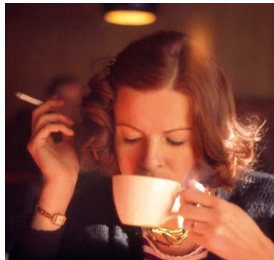
Die Zigarette zum Kaffee – wer mit dem Rauchen dauerhaft aufhören will, muss alte Verhaltensmuster durchbrechen.

Wie ist mein Rauchverhalten? Wann greife ich bevorzugt zur Zigarette? Welche Situationen habe