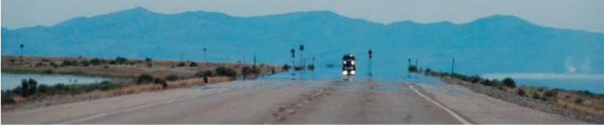
Die Oberfläche sieht aus wie Wasser, doch es handelt sich nur um eine Luftspiegelung.

das Licht abbremst, verbiegen sich die Sonnenstrahlen, wenn sie auf die wechselwarme Luft treffen. Die Grenzlinie zwischen warmer und kalter Luft wird somit zu einer Art Spiegel. Und darin nehmen wir nun etwas wahr, das sich in Wirklichkeit gar nicht hier befindet: Die Asphaltpfütze, der Wüstensee sind nichts als Spiegelbilder des blauen Himmels – reine Physik also, von Einbildung keine Spur.