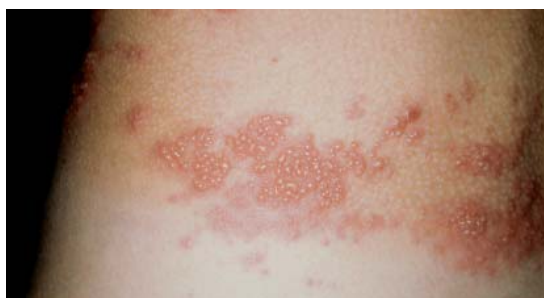
Bei der Gürtelrose wird das Windpocken-Virus erneut aktiv. Wie ein Gürtel zieht sich der Bläschenausschlag um den Körper.

■ Auch eine – meist sehr wirksame – Akupunkturtherapie so früh wie möglich beginnen.