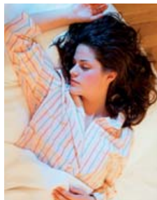
Auch wenn wir uns nicht daran erinnern, träumen wir jede Nacht.

Hirnforscher glauben, wir brauchen Träume nur, um uns zu erholen. Mehr nicht. Dem widerspricht die Psychologie: Träume sind nicht nur körperlich, sondern auch seelisch notwendig. Auch wenn das Phänomen Traum nicht eindeutig geklärt ist, gilt als erwiesen, dass Menschen, die regelmäßig am Schlafen und somit am Träumen gehindert werden, ernste seelische und physische Schäden erleiden.